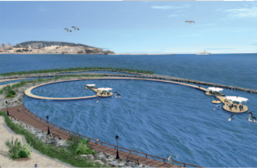
Delfin Areal mit Tanger im Hintergrund

Ein großzügiges Restaurant im Marokkanischen Stil rundet das einmalige Ausflugsangebot ab.